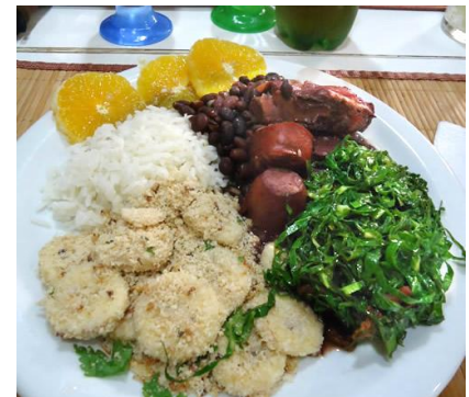
* Feijoada completa