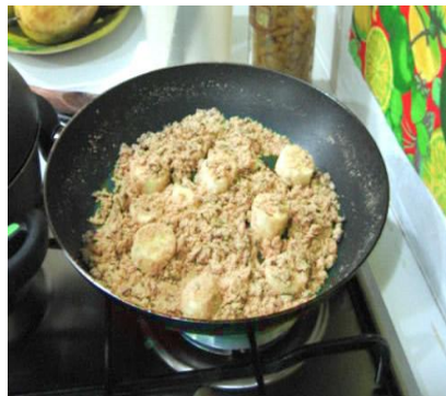
Farofa de banana