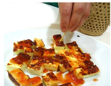
Queijo coalho com geleia de pimenta

* Podemos fazer moqueca e feijoada vegetariana para parte do grupo.